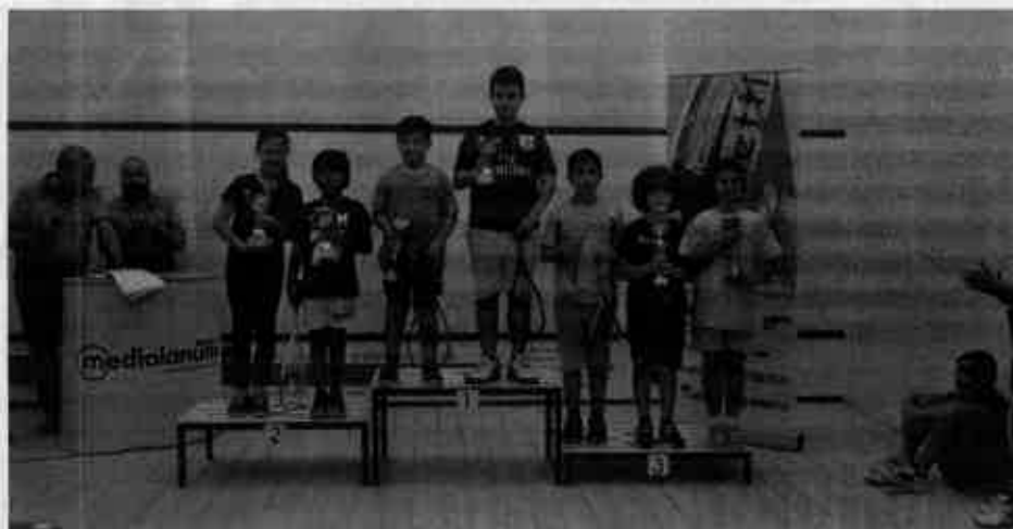
Il podio completo della categoria più giovane in gara: i Primi colpi