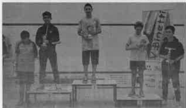
Il podio dell'Under 15 maschile