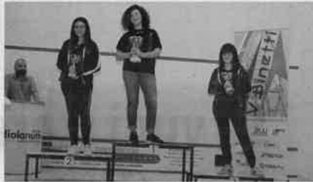
Il podio dell'Under 15 femminile