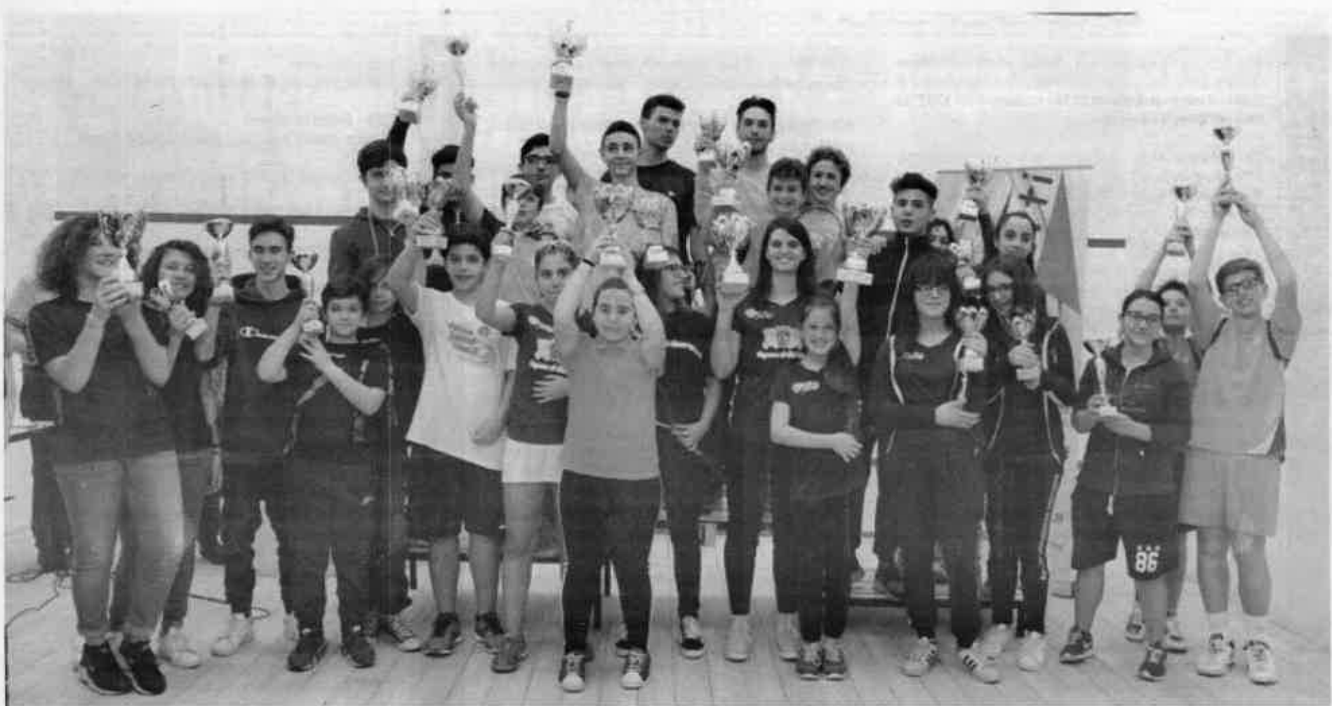
Foto di gruppo con tutti i vincitori al Torneo nazionale giovanile della Federazione italiana giuoco squash svoltosi a Rende nella struttura dello Scorpion