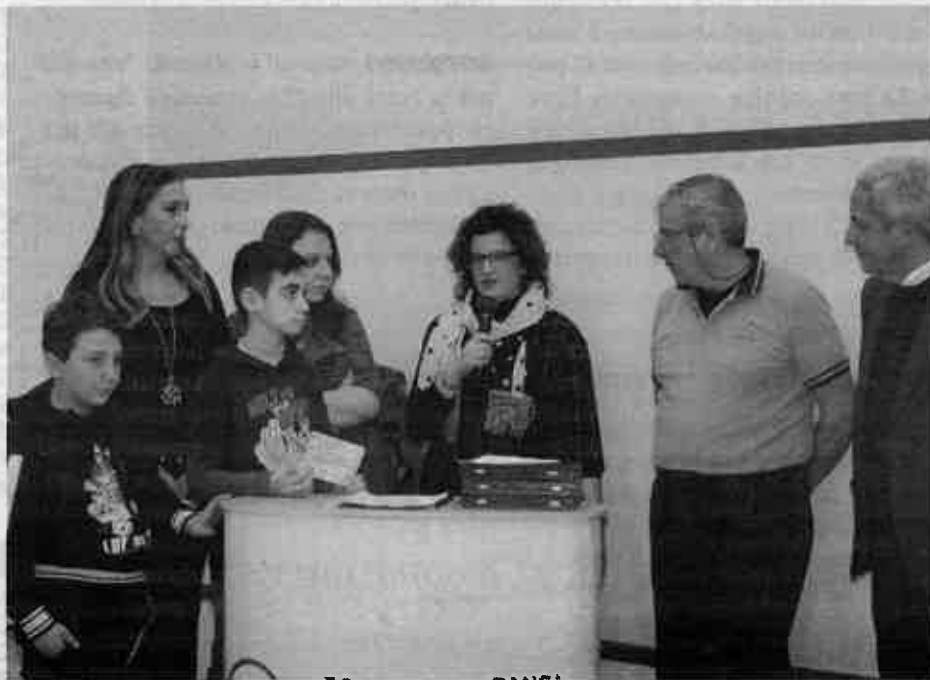
Il momento della consegna da parte della Squash Scorpion della somma in beneficenza

Una settantina di atleti si sono affrontati in sei diverse categorie femminili e maschili oltre ai "Primi colpi"