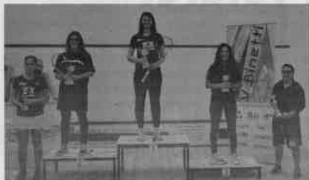
Il podio dell'Under 17 femminile