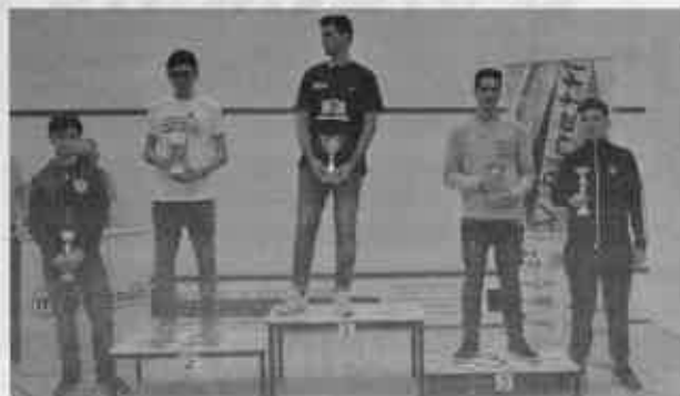
Il podio dell'Under 17 maschile