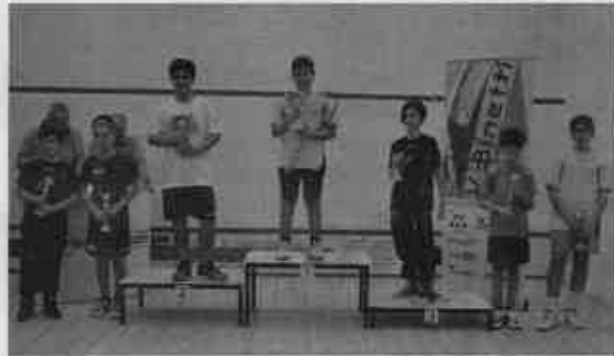
Il podio dell'Under 13 maschile