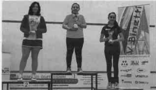
Il podio dell'Under 13 femminile